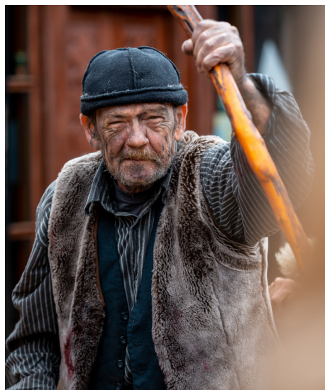
Røverne lå gemt i skoven og overfaldte sagesløse rejsende.

Ikke alle Bettefandens ofre var lige så heldige. Da røvernævret blev optrevet, blev Bettefanden dømt for 47 forbrydelser. Han blev benådet i 1864.