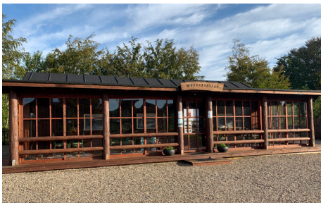
Westernhuset ved siden af Tophuset.