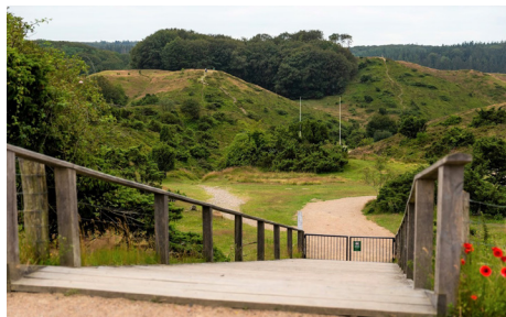
Dronningetrappe ned til gryden, hvor Rebildfesten afholdes d. 4 juli hvert år.