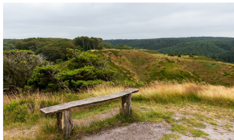
Udsigtspunkt fra Sønderkol.

Ud over den enestående natur, er Rebild kendt for at være mødestedet for danskere, amerikanere og dem, der er begge dele.