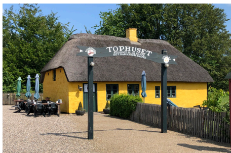
Tophuset ved indgangen til Rebild Bakker.