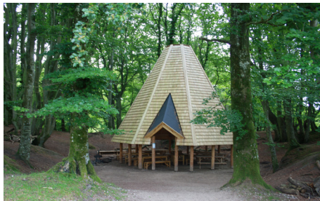
Max Henius bålhytte.

På vej ned til Gryden - på venstre side af stien, bag nogle træer - ligger Max Henius Hytten, en ottekantet bålhytte formet som en indiansk tipi. Hytten måler 8,5 meter i højden.