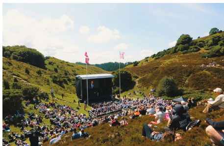
Rebildfesten i Gryden i Rebild Bakker.

Bakkerne rundt om Gryden danner et naturligt amfiteater. Her finder publikum en siddeplads under Rebildfesterne, eller når der engang imellem foregår andre kulturelle arrangementer. Et eksempel på dette er besøg af Den Kongelige Ballet.