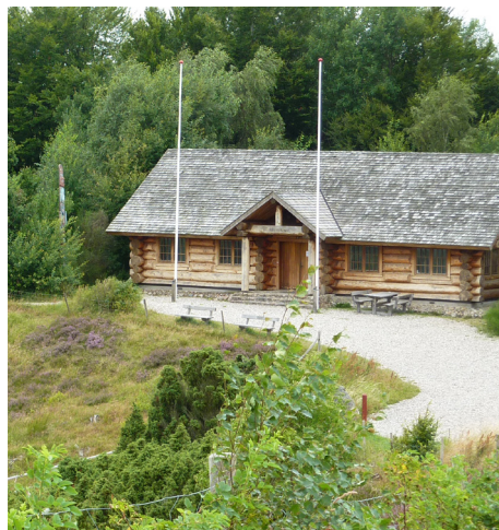
Blokhuset - The Lincoln Log Cabin, som står ved toppen af Rebild Bakker.

Blokhusmuseet blev en publikumsmagnet med mange besøgende hvert år, indtil det nedbrændte den 11. november 1993.