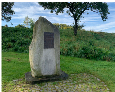
Mindestenen "Flyverstenen ved Rebild Bakker".